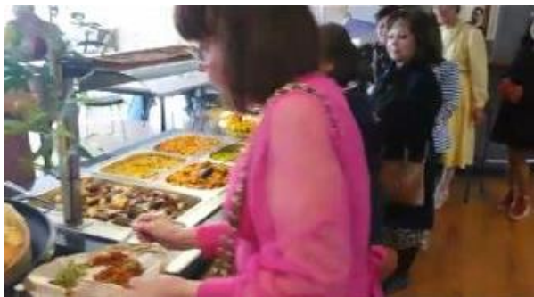
Een heerlijk buffet verzorgd door Toko Tante Annie.