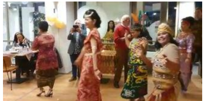
De dansvloer op voor een traditionele pojoh pojoh.